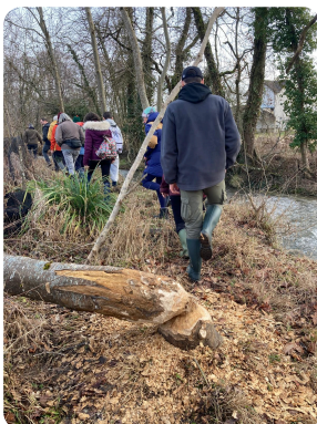
Sortie Castor 🦫