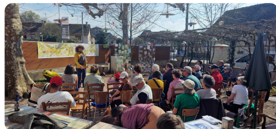
Sur les bords de la Bièvre 💧