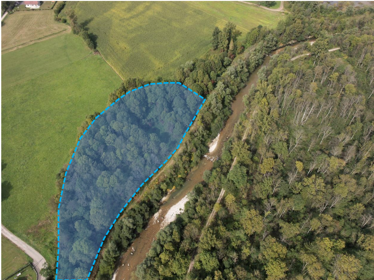
Vue aérienne de la parcelle ZC0051 acquise par le SIAGA